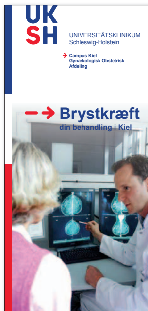
Patienteninformation zur grenzüberschreitenden Behandlung.

Eine weitere Möglichkeit für die Zusammenarbeit kann eine gemeinsame Stärkung bei der beruflichen Weiterbildung an Krankenhäusern im Grenzgebiet sein, zum Beispiel durch das Schaffen von gemeinsamen beruflichen Fortbildungen für medizinisches Personal. Ein sehr großes Potenzial besteht ebenfalls im Bereich von Technologien im Gesundheitsbereich wie zum Beispiel Informations- und Kommunikationstechnologien und Telemedizin.