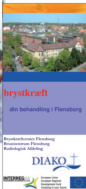
Information til patienter om behandling henover grænsen.

Den efterfølgende kontrol gennemføres efter at patienten er vendt hjem til Region Syddanmark. Set fra en administrativ synsvinkel, har Region Syddanmark muligheden for at indgå henvisningsaftaler med hospitaler eller læger i Schleswig-Holstein for at give en patient fra Region Syddanmark adgang til stationær behandling i Schleswig-Holstein. For scenario IV har projektet, ved udarbejdelse af retningslinjer for klinisk personale ved henvisning til UK-SH og DIAKO og informationsfolder til patienter, skabt forudsætningerne for et sådant samarbejde henover grænsen. Folderen og den beskrevne henvisningsprocedure for patienter fra Region Syddanmark til hospitalerne i Kiel og Flensburg åbner mulighed for et samarbejde, og henvisning af patienter kan let realiseres. Målsætningen er at gøre henvisningsproceduren så kort og så lidt ressourcerelevende som muligt.